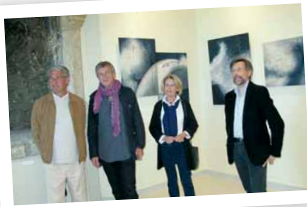
Quatre artistes locaux pour la première exposition présentée aux Renaudières.

tion aussi des disponibilités du planning, qui se remplit déjà. Mais rien n'est encore figé. Tout va se mettre en place peu à peu, le temps pour chacun de trouver ses marques et de s'approprier l'espace."