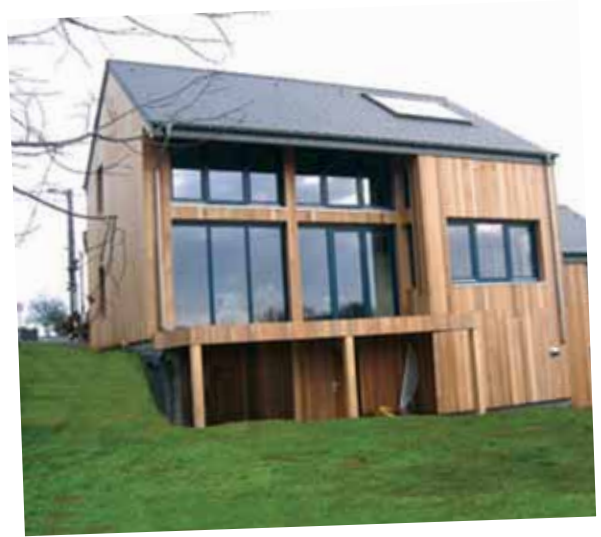
Exemple de maison à énergie positive.

La Ville a vendu un terrain lui appartenant, situé dans le quartier du Souchais, au constructeur privé Alliance qui s'est déclaré très intéressé par le projet de construction d'une maison à énergie positive. Plus qu'une simple délégation, il s'agit d'un véritable partenariat.