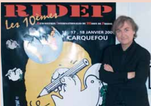
Plantu, le dessinateur fétiche du journal Le Monde, signataire de l'affiche de cette année, a participé à plusieurs conférences.