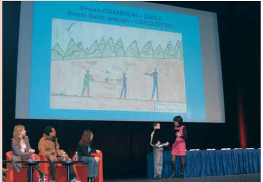
Remise des prix du concours organisé auprès des écoles, collèges et lycées : 800 élèves présents le vendredi.