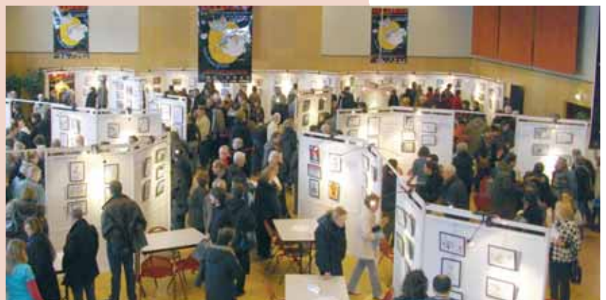
Un public passionné est venu à la rencontre des dessinateurs de presse afin de découvrir leur métier.