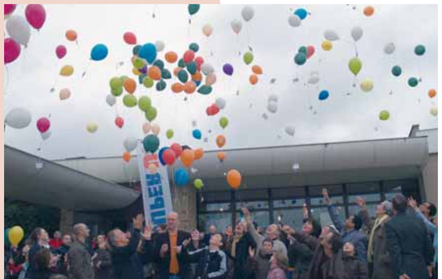
Lâcher de ballons porteurs de messages de paix et d'espoir.