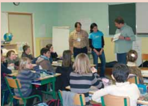
Visite des dessinateurs étrangers dans les écoles et collèges de Carquefou.