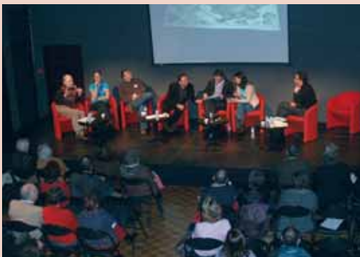
Les rencontres-débats font salle comble.