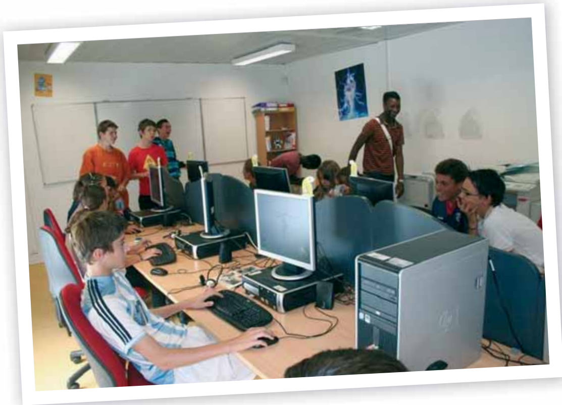
Après inscription, l'espace multimédia est en accès libre, sous la surveillance de l'animateur.

En inaugurant en 2006 un espace multimédia, la municipalité a d'abord voulu répondre aux attentes des jeunes. Mais elle a aussi souhaité permettre l'accès du plus grand nombre aux nouvelles technologies pour éviter la fracture numérique. Pari gagné.