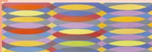
Pierre Mabille, sans titre, 2007 acrylique sur toile, 85 x 250 cm

Depuis 2006, le grand mur du hall d'accueil du Frac est investi par des artistes. La pratique des wall drawing et wall painting permet de faire naître des dialogues pertinents entre architecture et arts visuels.