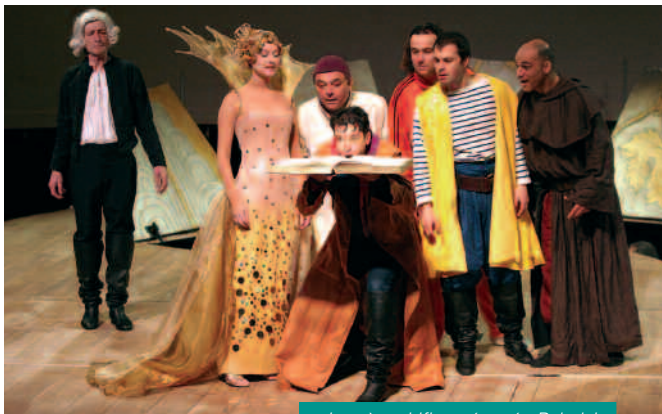
La très mirifique épopée Rabelais

Par les Tréteaux de France, mise en scène Marcel Maréchal.