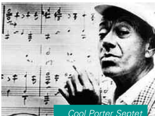
Cool Porter Septet

Nouveaux horaires : lundi de 14 h à 18 h,