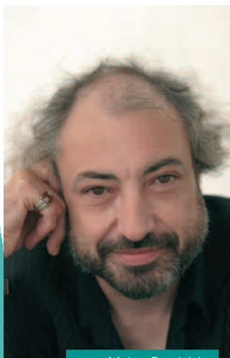
Moi et Baudelaire