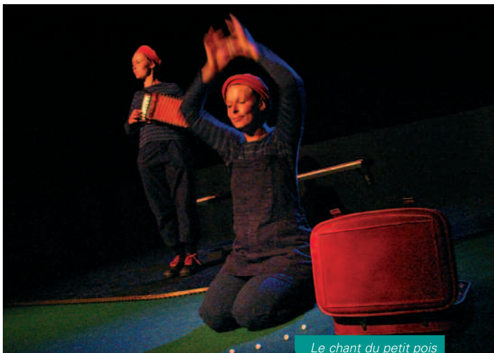
Le chant du petit pois

"Deux personnages en discussion, deux lampes qui se rapprochent, des regards échangés et le public est conquis. C'est à la fois émouvant et gai. L'écriture est riche et truculente. Ce livre devrait réconcilier chacun avec son mal-être". Ouest-France A partir de 15 ans. Durée : 1 h 15. Pour toutes ces animations, inscriptions souhaitées à la Médiathèque.