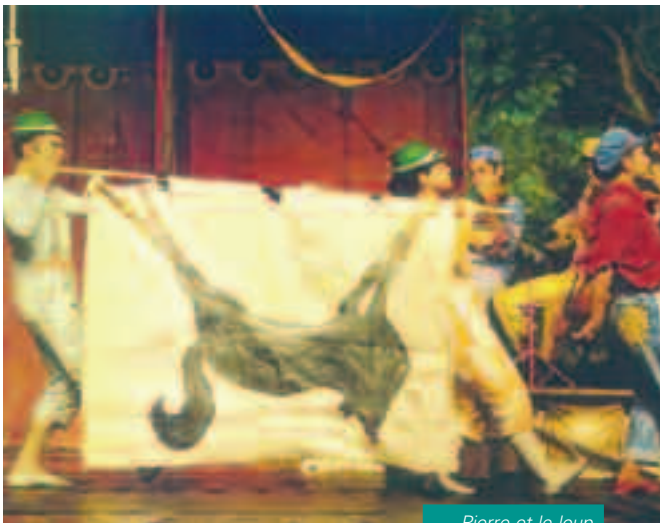
Pierre et le loup

On le croit parfois en perte de vitesse, en train de s'éteindre. Pourtant, chaque fois il renaît. Le jazz est infatigable ! Que les temps soient techno ou pop, il est toujours là comme au début du siècle. Durant cette soirée, l'École de Musique de Carquefou vous per-