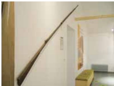
Un fusil à grenouilles, objet insolite actuellement présenté au musée