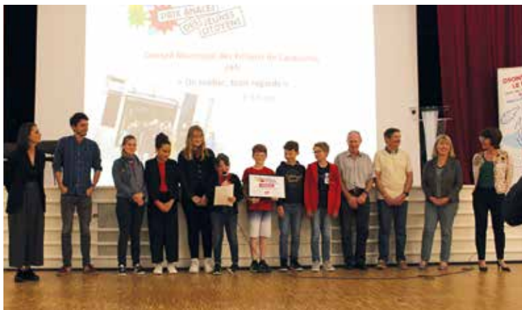
▲ Les conseillers municipaux enfants reçoivent le prix des Jeunes Citoyens de l'ANACEJ pour leur projet vidéo.