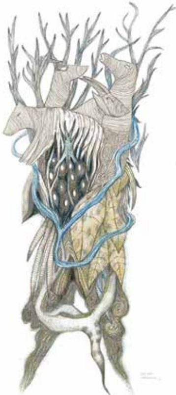
▲ Sans titre - Dessin.

Son art est inspiré par la nature, la préhistoire ou les monuments néolithiques. Participant à des fouilles archéologiques, l'artiste est sensible au vécu et son travail est empli de la mémoire du temps.