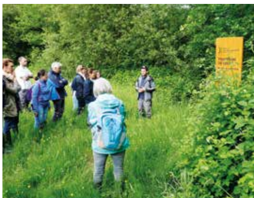
▲ Visite de la Tourbière de Ligné organisée par le musée de l'Erdre avec l'association Bretagne Vivante.