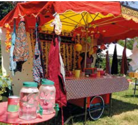
▲ La Tambouille graphique.

Vous découvrirez cette année Macabane , des ateliers de construction de cabanes en bois grandeur nature à réaliser en équipe, de la chute libre pour les amateurs de frissons, de l'initiation aux sports urbains et électriques (trottinettes, skates...), des spectacles alliant humour et réflexion L'était est là ou encore façon Bill Tcherno ; une autre manière d'aborder le sujet de l'écologie.