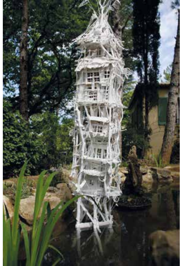
▲ Tour - 2012/2013 - Assemblage de bois peint - 220 cm.