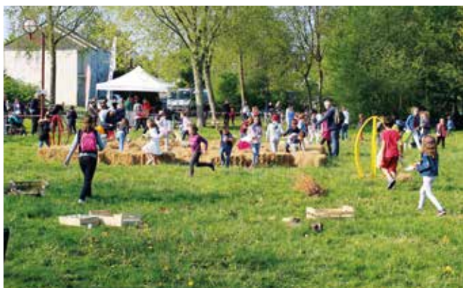
▲ La Chasse aux œufs organisée par le Conseil Municipal Enfants a offert un vrai moment de convivialité aux enfants venus nombreux. Plus de 80 kg de chocolat distribués !