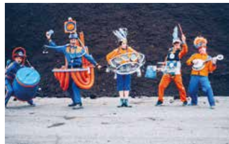
▲ Fanfare Rékupertou.

- A 23 h : Un feu d'artifice haut en couleurs.