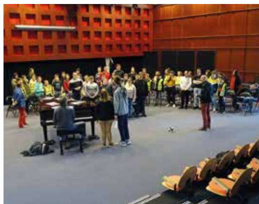
▲ Rallye citoyen organisé pour les 400 élèves de 6 e de la commune afin qu'ils prennent conscience de l'importance de leur place en tant que citoyen. Concert partagé avec les élèves de l'IME Pen Bron de la Fleuriaye.