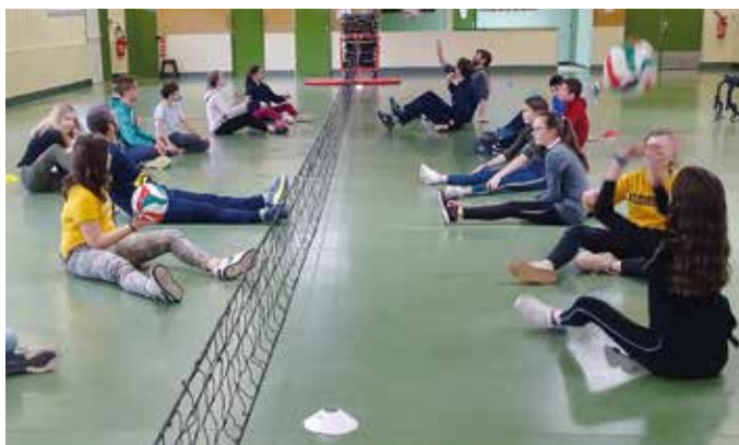
▲ Journée de sensibilisation au handicap pour les élèves de 5 e du collège Gérard Philipe avec 14 ateliers permettant d'appréhender concrètement les différents handicaps.