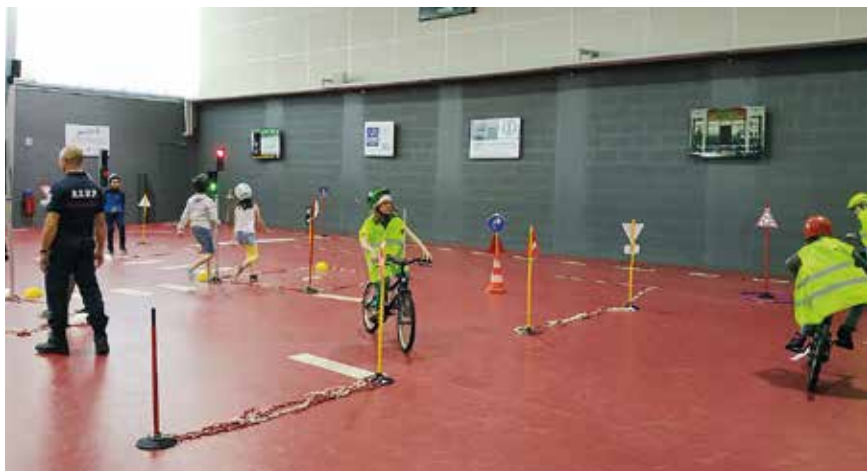
▲ Ateliers de mobilité.