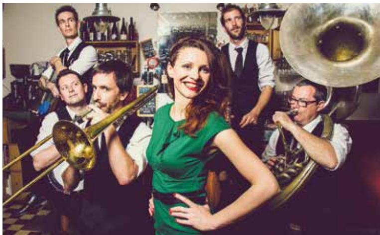
▲ The Sassy Swingers

Accompagnés en fanfare avec Kalbanik's Orchestra (14 h 30) et en musique avec Jet4tet (16 h 30).