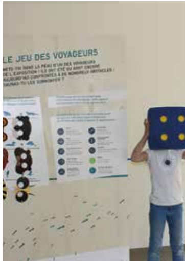
▲ Exposition "Incroyables voyageurs". L'aventure au fil de l'eau © Maison du Lac de Grand-Lieu.

Découvrez les révolutions techniques utilisées pour pister ces