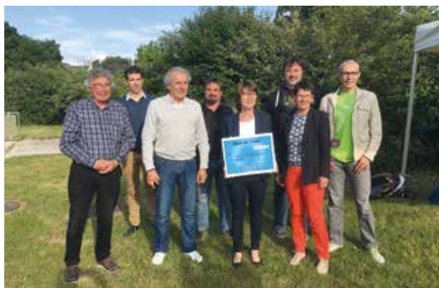
▲ Remise d'un chèque de 1509 € à l'Unicef suite à l'organisation de la Nuit de l'eau par la Ville, l'Aquatic Sport Carquefou et le club Plongée Kornôg Carquefou.