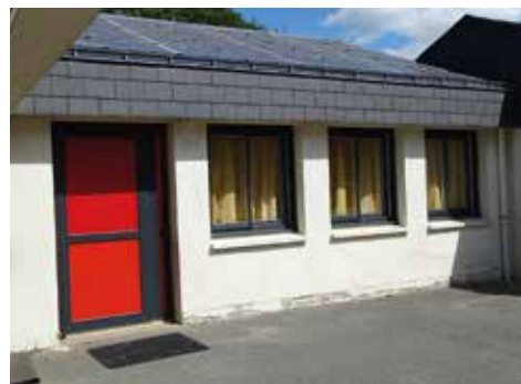
▲ Travaux école Georges Brassens.