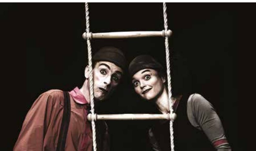
▲ Baccala-Oh oh

Cette année, c'est sous le signe de la diversité que nous vous embarquons pour un agréable voyage de l'esprit.