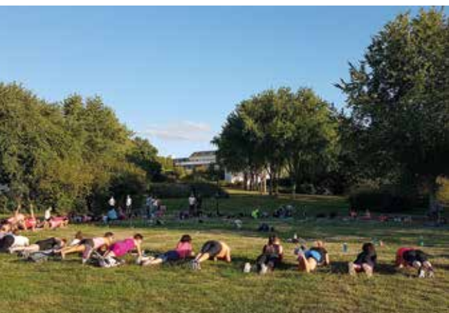
▲ Training en plein air : plus de 100 participants pour cette séance de sport collective et conviviale dans le vallon du Charbonneau.