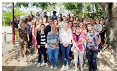
▲ Réunion de pré-rentrée des animateurs et des ATSEM.

Sans oublier les ATSEM (Agents Territoriaux des Écoles Maternelles) qui accompagnent au quotidien le personnel enseignant dans l'éducation des jeunes enfants, sachant qu'il y a autant d'ATSEM que de classes maternelles. Ils participent au bon fonctionnement de l'école maternelle en créant un environnement sécurisant pour permettre aux jeunes enfants de s'épanouir et grandir.