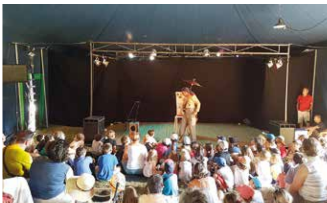
▲ La GRANDE Semaine : cet événement estival a réuni un public enthousiaste autour d'animations variées et originales.