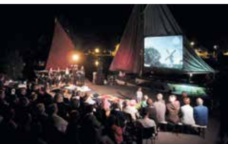
▲ Présentation du ciné-concert à Nort-sur-Erdre.

Auditorium de l'École Municipale de Musique