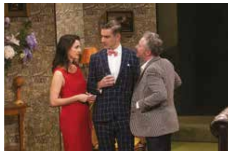
▲ Le canard à l'orange © Céline Nieszawer.

Séance supplémentaire pour la pièce Le Canard à l'Orange le samedi 8 février à 16 h 30, avec Nicolas Briançon, Anne Charrier, François Vincentelli, Sophie Artur, Alice Dufour. Une pièce nommée 7 fois aux Molières et proposée en audiodescription le samedi à 20 h 45.