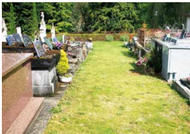
▲ Cimetière Mairie Val de Louyre : exemple d'enherbement des allées.

Depuis plusieurs années Carquefou est engagée dans une démarche de réduction d'utilisation de produits phytosanitaires et favorise les techniques alternatives.