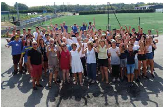
▲ Raid'Erdre propose à 12 équipes de 4 jeunes une semaine d'aventures sportives et festives. L'équipe gagnante se dénomme Les Carottes Râpées (4 garçons) et le Prix du Fair Play a été attribué aux Touristes (4 filles).