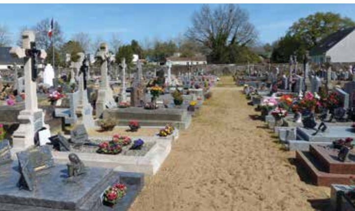
▲ Cimetière des Gauteries – avant.