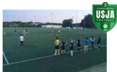
▲ Les féminines à l'entraînement.

La saison 2019/2020 s'ouvre aussi sur une touche plus féminine : l'arrivée de jeunes filles de tous âges qui vont fouler les