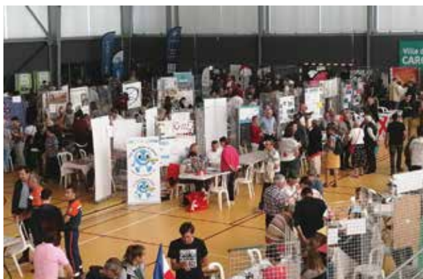
▲ Forum des associations : un public toujours nombreux à venir à la rencontre des associations.