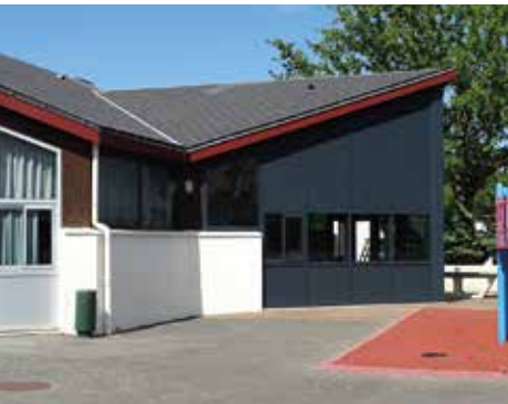
▲ Travaux école Anne Frank.

La Direction des Bâtiments de la Ville a profité de l'été pour effectuer divers travaux d'aménagement et d'entretien au sein des structures municipales.