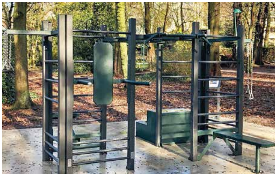
▲ Exemple de station.

Il s'agit d'un projet initié par le Conseil Consultatif des Seniors. Il est implanté dans le Vallon du Charbonneau, site propice aux animations et aux échanges.