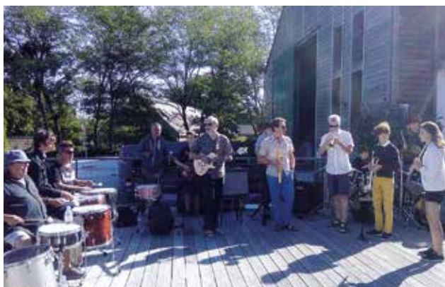
▲ Rendez-vous de l'Erdre à Port-Breton , pour un concert de Bernard Lubat, poly-instrumentiste et Fabrice Vieira, avec les élèves de l'École Municipale de Musique.