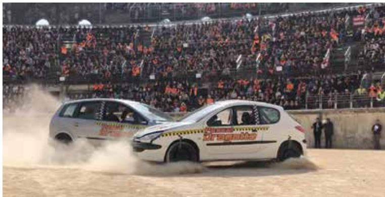
▲ Opération Dragotto.

• Participation de la Gendarmerie vendredi 11 de 10 h à 12 h et de 14 h à 17 h sous l'Espace Mellay et salle Béthanie : présence de motards, d'une équipe cynophile, d'une équipe en technique criminelle expliquant les investigations sur