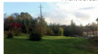
Après travaux :