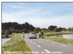
Chaussée à voie centrale banalisée (ou chaussidou)